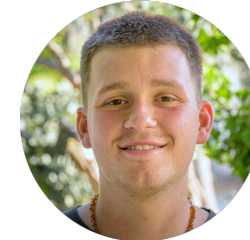
Konstantin Puritscher Events und Gastronomie